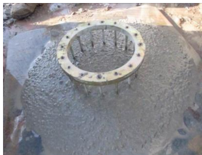
Figura nº 04

Figura nº 03 – Borda segregando – In loco – EC1: - Detalha no slump flow em cuja borda pode-se observar uma segregação de 2 cm a 3 cm por todo o perímetro. Isso evidencia instabilidade da dosagem, segundo ASTM 1611C/1611M/2014 classifica-se como IEV de 3.