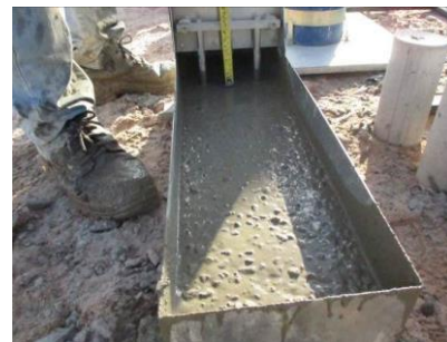
Figura nº 05

Figura nº 04 – Ensaio J-Ring – In loco – EC1: - O resultado obtido no anel J foi de flow de 720 mm, 4 mm apenas menor que o slump flow, sendo classificado conforme ABNT NBR 15823/10 parte 1, como PJ1. Nota-se a uma segregação de borda visualizada no ensaio slump flow, ratifica a instabilidade da mistura.