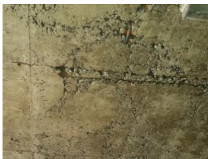
Figura nº 19

Figura nº 18 – Falha de concretagem:- Nota-se o resultado da aplicação do concreto sem as características adequadas de coesão e fluidez, o que gerou a manifestação patológica observada. Esta patologia foi observado em praticamente todos estudos de caso.