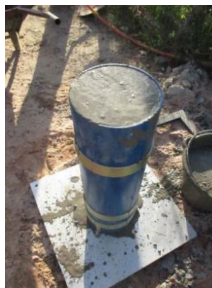
Figura nº 07

Figura nº 06 – Execução do Ensaio Funil V– EC1: - O tempo de escoamento T_{30s} foi de 3 s, sendo classificado como VF1 e na etapa T_{5mim} o funil V travou devido à segregação o concreto, evidenciando a instabilidade da mistura do concreto e considerado inadequado para aplicação.