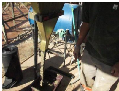
Figura nº 11

Figura nº 10 – Ensaio J Ring – In loco – EC2: - Observa-se uma leve segregação de argamassa por toda a auréola do CAA. O resultado obtido neste ensaio foi 680 mm, 35 mm inferior ao slump flow, sendo classificado como PJ2 conforme ABNT NBR15823/10.