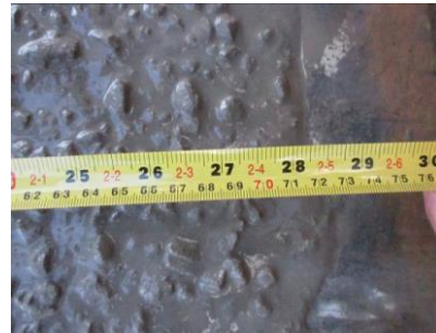
Figura nº 03

Figura nº 02 – Ensaio de slump flow – In loco – EC1: - Observa-se que o concreto apresenta-se com slump flow de 724 mm, dentro dos parâmetro especificado pela concreteira de 700 \pm 50 mm e classificado conforme ABNT NBR 15823/2010 como classe SF2, nota-se na Figura 02 que o concreto está com evidente segregação.