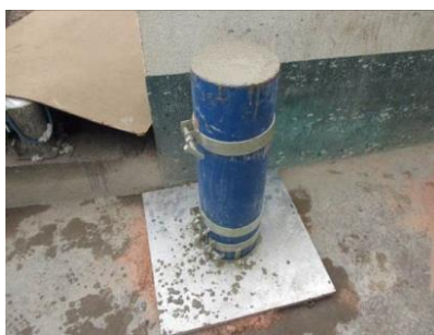
Figura nº 16

Figura nº 15 – Ensaio de funil V – In loco – EC3:- O resultado obtido para o T_{30s} e T_{5\text{ min}} foram 3,24 s e 6,24 s respectivamente e classificado como VF1.