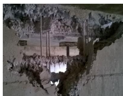
Figura n° 18