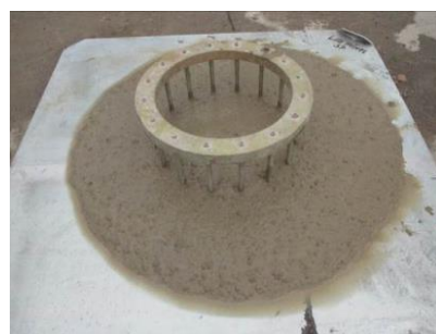
Figura nº 13

Figura nº 12 – Ensaio de flow – In loco – EC3: - Execução in loco do ensaio de slump flow cujo resultado obtido foi de 695 mm, e classificado com SF2 atendendo a especificação