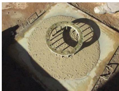
Figura nº 10

Figura nº 09 – Ensaio de slump flow – In loco – EC2: - A borda de argamassana maior parte da auréola inferior a 2 cm, visualizada no CAA. Notam-se as britas aflorando e uma concentração maior ao centro, seguindo os critérios da ASTM C1611/C1611M/2014 o IEV igual 2 tendendo a 3.