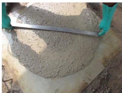
Figura nº 08

As Figuras de nº 08 a 11 ilustram os resultados obtidos in loco e as respectivas análises e comentários que classificam o CAA no estado fresco conforme a metodologia proposta como descrito a seguir: