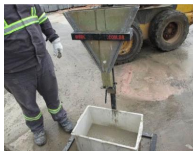
Figura nº 15

Figura nº 14 – Ensaio de Caixa L - In loco – EC3: - O resultado obtido de H2/H1 foi de 0,84, observou-se na aplicação que o concreto apresentou dificuldade quanto à habilidade passante classificado com PL2.