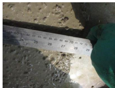
Figura nº 09

Figura nº 08 – Ensaio slump flow– In loco – EC2 - O resultado obtido de slump flow para CAA foi de 715 mm, dentro da faixa especificada pelo projetista de 65 a 75 cm, classificado como SF2. Nota-se – ao centro – a pouca concentração de brita nas bordas e uma auréola formada pela segregação do concreto.