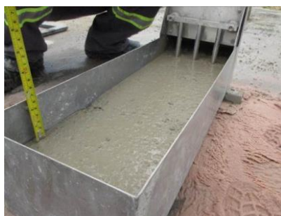
Figura nº 14

Figura nº 13 – Ensaio do anel J – In loco – EC3:- O resultado obtido no ensaio do Anel J foi de 660 mm, 35 mm inferior ao ensaio de slump flow o que classifica como PJ2 conforme ABNT 15823/2010 como PJ2 em sua habilidade passante.