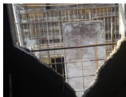
Figura nº 22

Figura nº 21 – Parede com junta fria: - Nota-se que o concreto aplicado na estrutura não se apresentava com as características autoadensável necessárias para aplicação. Observam-se três juntas frias de orientações distintas na parede.