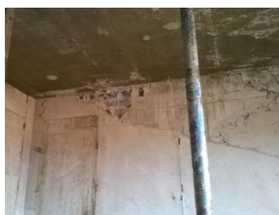
Figura nº 21

Figura nº 20 – Surgimento de Fissuras:- A fissura de 0,4 mm apresentada na Figura nº 20 ocorreu com idade inferior a sete dias em diversos vão principalmente de janelas.