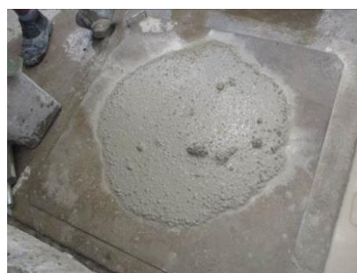
Figura nº 12

As Figuras de nº 12 a 16 ilustram os resultados obtidos in loco e as respectivas análises e comentários que classificam o CAA no estado fresco conforme a metodologia proposta como descrito a seguir: