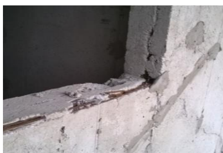
Figura n° 17

As Fig. de 17 a 22 ilustram as consequências da aplicação nas estruturas do concreto sem as características de autoadensável requeridas em projeto. Foram observadas as seguintes manifestações patológicas durante a realização deste trabalho: