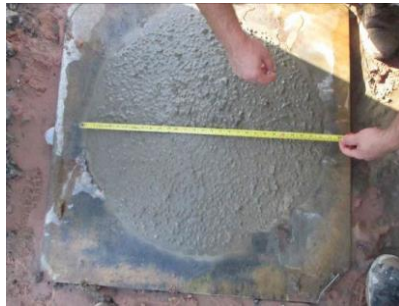
Figura nº 02

As Figuras de nº 02 a 07 ilustram os resultados obtidos in loco e as respectivas análise e comentários classificam o CAA no estado fresco conforme a metodologia proposta como descrito a seguir: