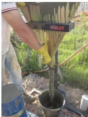
Figura nº 06